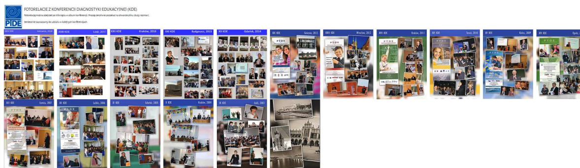
Ryc. 3. Podstrona www.ptde.org – SPOŁECZNOŚĆ