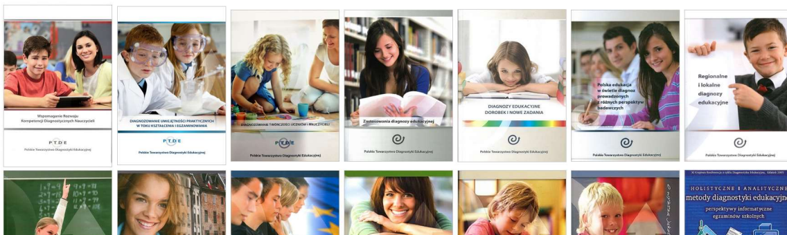
Ryc. 4. Podstrona umożliwiająca dostęp do tekstów i wydarzeń

W okresie sprawozdawczym zostały przygotowane i udostępnione OTWARTE ZASOBY POLSKIEGO TOWARZYSTWA DIAGNOSTYKI EDUKACYJNEJ . Bezpośrednio z tej podstrony jest dostęp do ponad 1200 tekstów, które powstały, były opublikowane i przedstawione podczas dwudziestu pięciu Konferencji Diagnostyki Edukacyjnej. Z tej strony dostępne są również wejścia do serwisów: