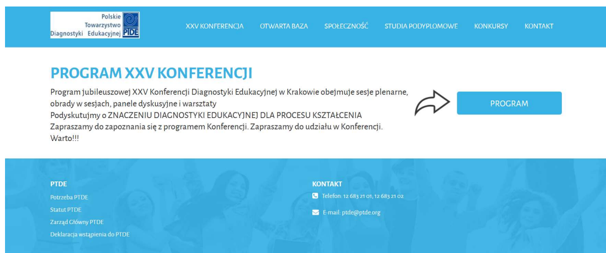
Ryc. 1. Widok strony głównej www.ptd.org w okresie przedkonferencyjnym

W okresie sprawozdawczym (2016–2019) nastąpiła zasadnicza modernizacja strony domowej PTDE dzięki dużemu zaangażowaniu Marka Legutki (sekretarza ZG). Na podkreślenie zasługuje uzupełnienie i unowocześnienie podstrony OTWARTA BAZA, na której jest dostęp do zasobów (ponad 1200 artykułów) powstałych podczas dwudziestu pięciu kolejnych Krajowych Konferencji Diagnostyki Edukacyjnej. Poniżej przedstawiamy kilka najważniejszych podstron, które ilustrują działalność Towarzystwa.