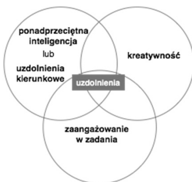
Rysunek 1. Pierścieniowy model Renzulliego