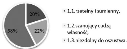
Rysunek 2. Cechy człowieka uczciwego

W przypadku definiowania człowieka uczciwego respondenci udzielający odpowiedzi w drugiej ankiecie, uczniowie klas pierwszych i drugich liceum, przyjmowali narzuconą przez pytanie konwencję i charakteryzując, posługiwali się czasownikami w formie osobowej, imiesłowami i przymiotnikami.