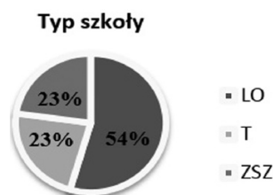
Rysunek 1. Podział respondentów ze względu na typ szkoły

Ponieważ zagadnienie rozpoznawania i definiowania wartości uznano za szczególnie istotne, diagnozę rozszerzono także na inną szkołę i ostatecznie w badaniu wzięło udział 274 respondentów, uczniów dwóch szkół ponadgimnazjalnych w mieście powiatowym liczącym około 25 tys. mieszkańców. 202 ankiety zawierały pytania zamknięte i otwarte. 72 respondentów wypełniało kwestionariusze zawierające tylko pytania otwarte. Udział młodzieży z poszczególnych typów szkół kształtował się następująco: