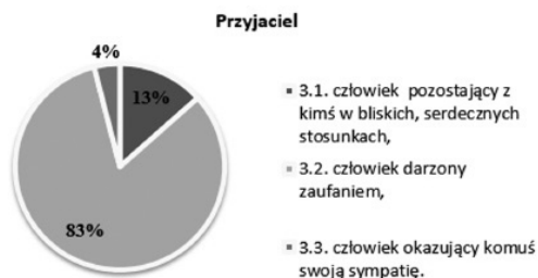
Rysunek 4. Cechy przyjaciela

W odpowiedziach na pytania otwarte także dominuje postrzeganie przyjaciela jako osoby, którą darzy się zaufaniem: